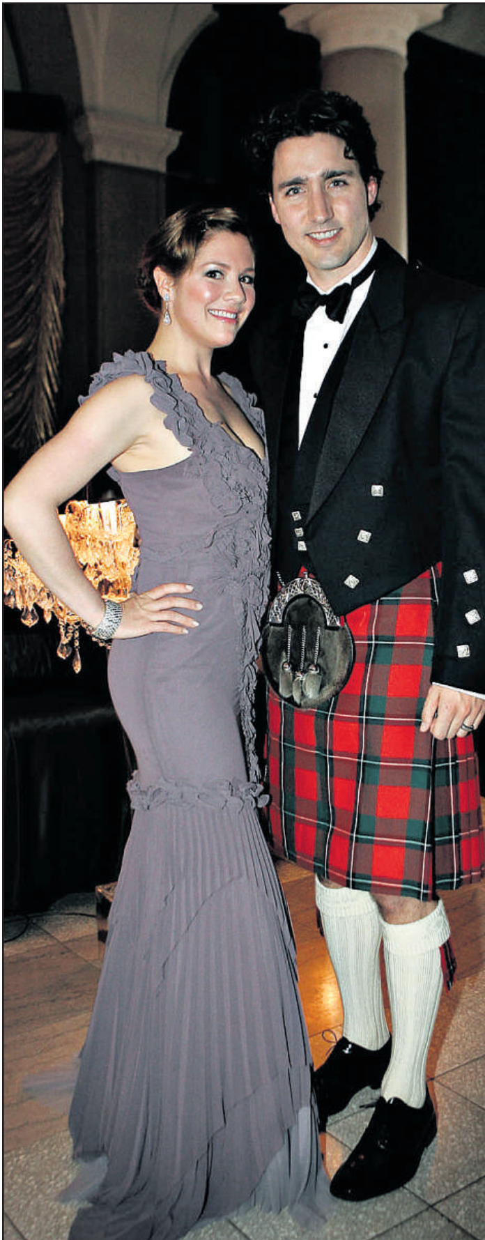
■ Le couple Sophie Grégoire et Justin Trudeau en était à sa 2 e sortie publique depuis la naissance de son petit garçon.